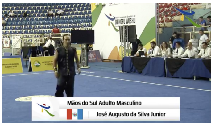
Transmissão das competições de Taolu.