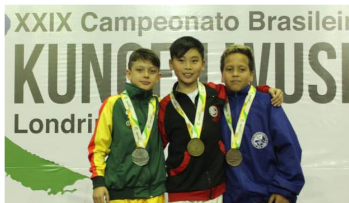
Cerimonial de Premiação.