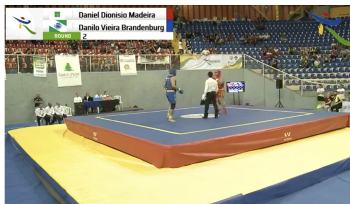
Transmissão das finais de Sanda.